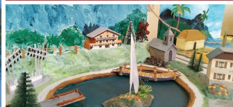
ÉGLISE ST PIAT