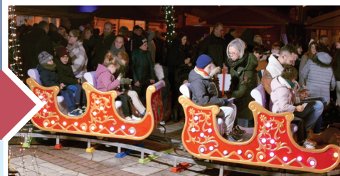
PETIT TRAIN DE NOËL