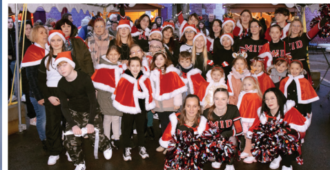
MOVE IN DOURGES