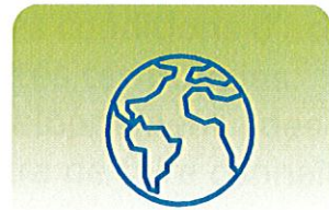
LUTTE CONTRE LE CHANGEMENT CLIMATIQUE

Le Schéma Régional d'Aménagement, de Développement Durable et d'Égalité des Territoires (SRADDET) est l'opportunité de bâtir un nouveau modèle d'aménagement du territoire. L'action régionale coordonne ainsi 11 domaines définis par la loi qui interviennent directement dans le quotidien des habitants des Hauts-de-France :