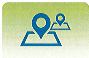
ÉQUILIBRE DES TERRITOIRES