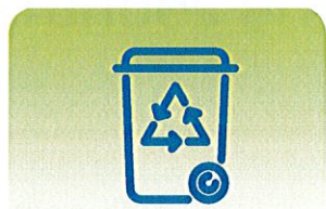
PRÉVENTION ET GESTION DES DÉCHETS