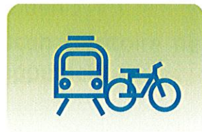
INTERMODALITÉ ET DÉVELOPPEMENT DES TRANSPORTS