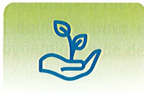
PROTECTION ET RESTAURATION DE LA BIODIVERSITÉ