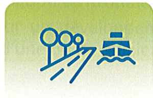
IMPLANTATION D'INFRASTRUCTURES D'INTÉRÊT RÉGIONAL