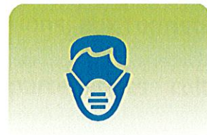
POLLUTION DE L'AIR