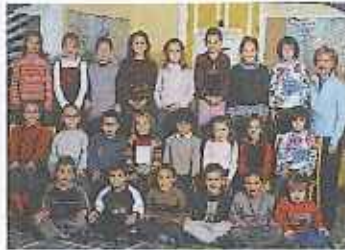
ÉCOLE JULES FERRY 2003 - 2004