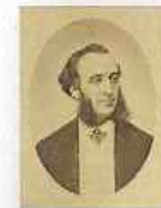
Jules Ferry (1832-1893)

contrôle et l'enseignement religieux sera dispensé en dehors des heures de classe.