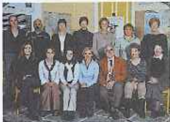
ÉCOLE JULES FERRY 2003 - 2004

Aujourd'hui, l'école Jules Ferry a été entièrement rénovée par la Municipalité ; elle est composée de 10 classes et fréquentée par 243 élèves ( rentrée 2012 ).