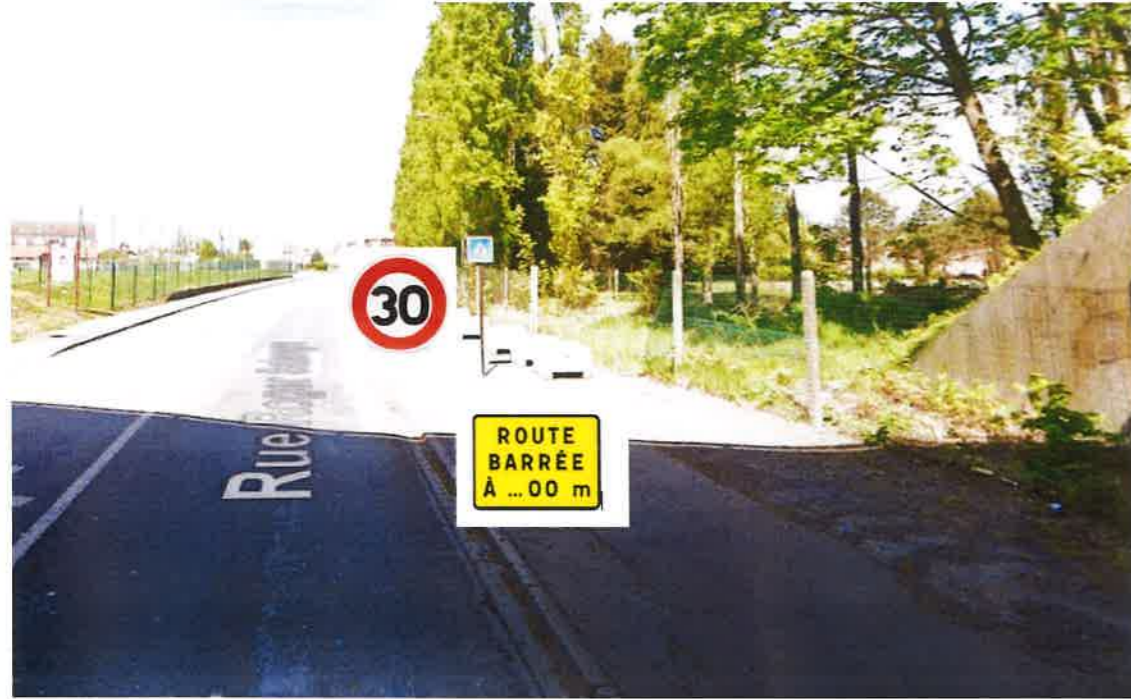
Route barrée a 200m , travaux en cours. Vue venant de la rue Salengro

Phase 1 bis du 10 juillet 2023 au 07 août 2023 8