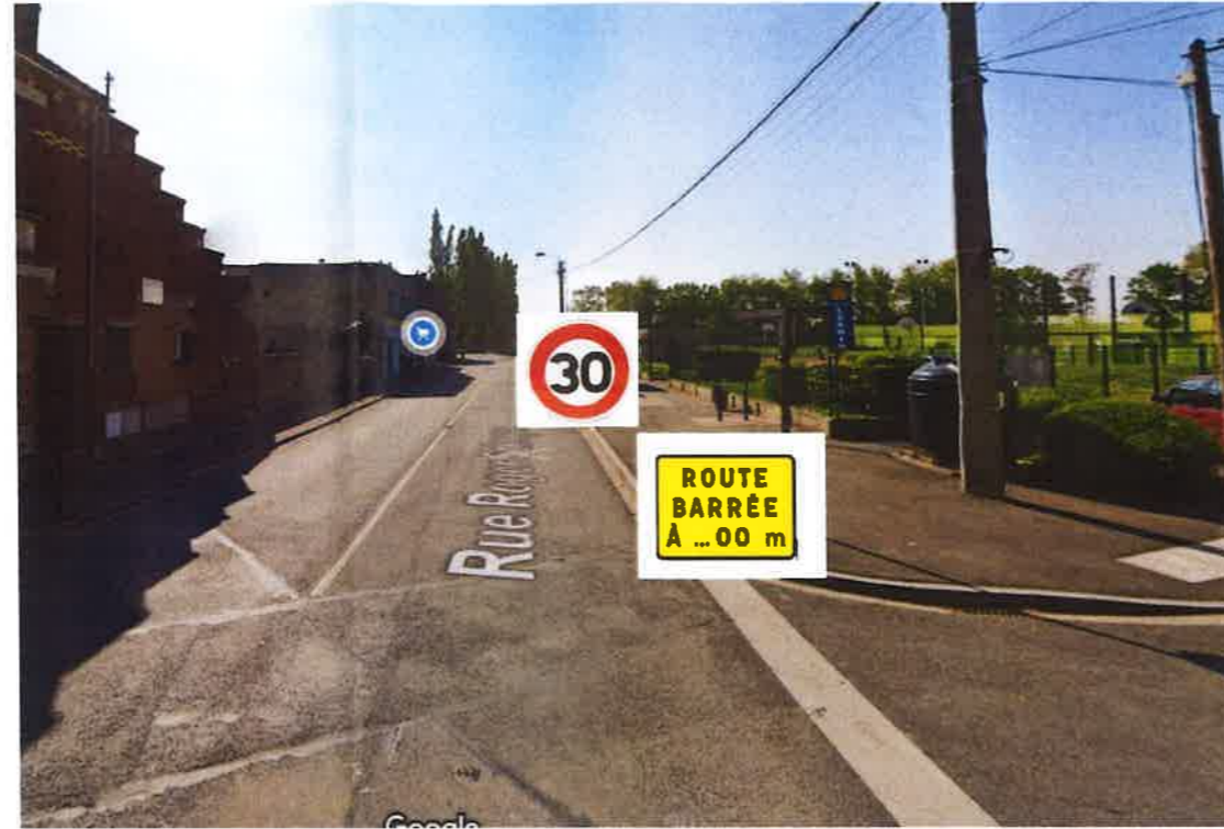
Route barrée a 200m , travaux en cours Vue venant du centre de Douges

Vu pour être annexé à l'arrêté de ce jour. N° 20231376 Douges, le 05 JUL. 2023