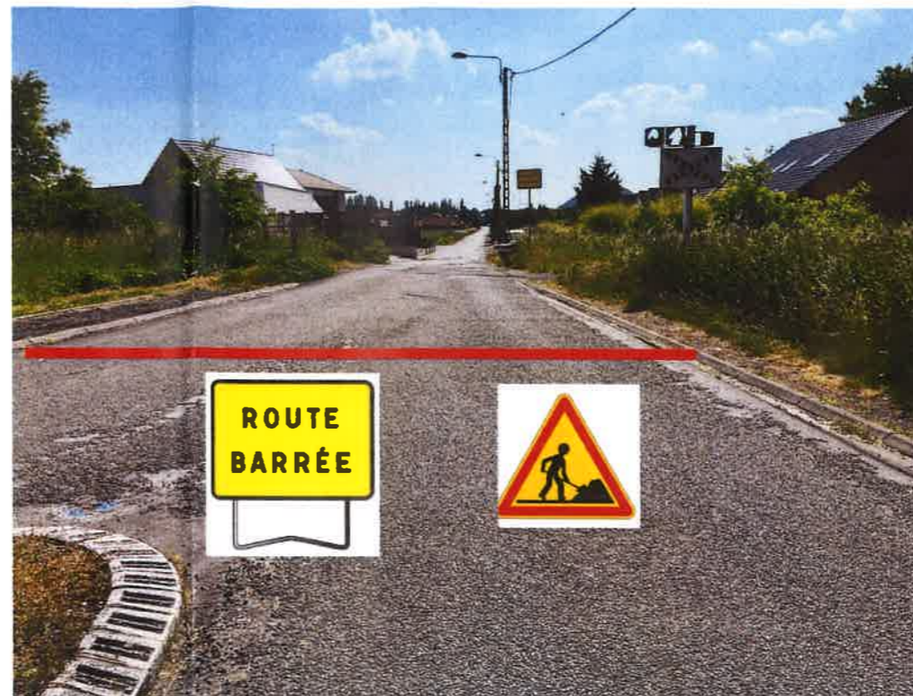
Mise en place de barrière Heras + panneau travaux et route barrée

Vu pour être annexé à l'arrêté de ce jour.