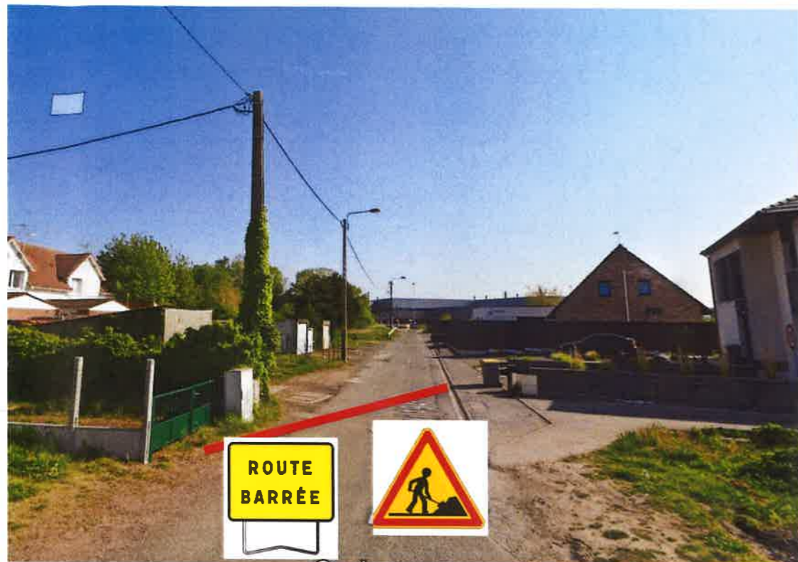
Mise en place de barrière Heras avec maintien de l'accès pour la maison médical depuis l'accès collège

Phase 2 du 18 septembre 2023 au 31 octobre 2023