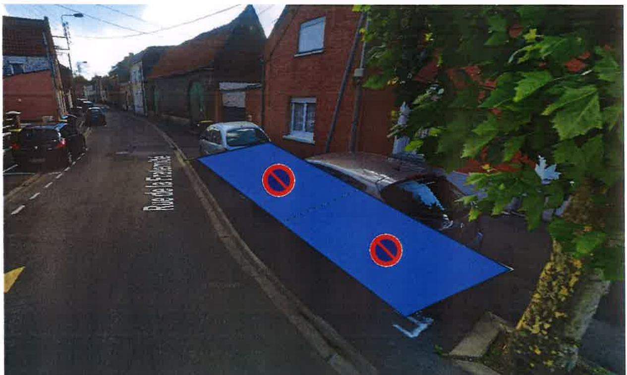
Stalles de stationnement situées devant le 26 et 28 rue de la fraternité : Stationnement sur le trottoir

Vu pour être annexé à l'arrêté de ce jour.